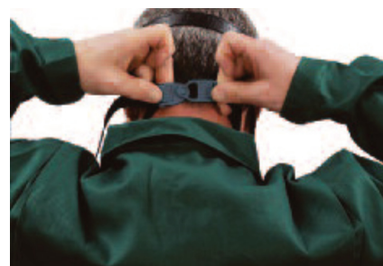
Schließen Sie die Nackenschnallen und ziehen Sie beide Riemen gleichmäßig an