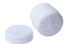
Vorfilter für Filterpatrone