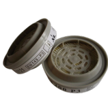
Advantage 200 Partikelfilter P3