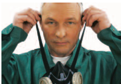
Legen Sie die Kopfbänderung am Kopf an