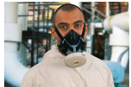
Advantage 410 mit P3 PlexTecFilter

Nähere Information zu den Standardgewindefiltern finden Sie in der Broschüre 05-100.2.