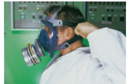
Ziehen Sie die beiden unteren Riemen fest

Die Vollmaskenserie Advantage 3000 bietet sowohl Schutz als auch unvergleichlichen Komfort. Die weiche Dichtlinie aus hypoallergenem Silikon sorgt für einen druckfreien Sitz. Die große, optisch korrigierte Sichtscheibe sorgt für eine klare, unverzerrte Sicht, während die graublau Farbe der Maske ein ästhetisches Aussehen verleiht.