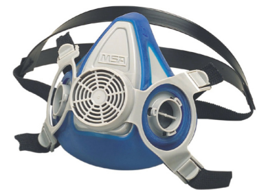
Advantage 200LS Halbmaske

Die Advantage 200 LS ist eine komfortable, wirkungsstarke und wirtschaftliche Halbmaske. Sie ist ideal bei Anwendungen mit je nach Arbeitssituation wechselnden Gefährdungen der Arbeiter, etwa durch hohe Rauch-, Nebel- und Gaskonzentrationen.