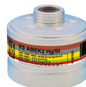
Kombinationsfilter 93 ABEK2-Hg/St