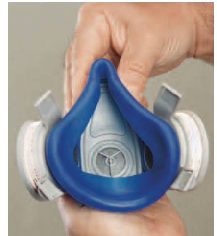
Perfekter Sitz der Maske am Gesicht durch Anthrocurve