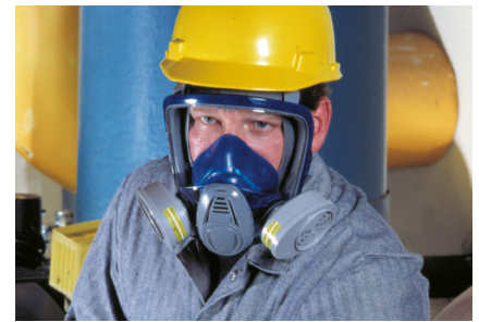
Advantage 3200 mit Advantage Gasfiltern

Die Advantage Filterserien sind für die Verwendung mit Advantage 3200, Advantage 200 LS und Advantage 420 vorgesehen.