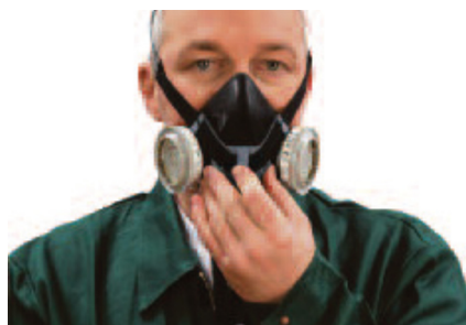
Ziehen Sie die vorderen Riemen nach unten ziehen und verriegeln Sie den Hebel