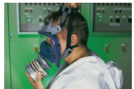
Streifen Sie die Kopfbänderung über Ihren Kopf