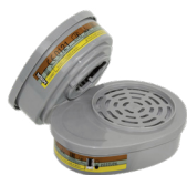
Advantage 201 Chemikalienfilter A2B2E1