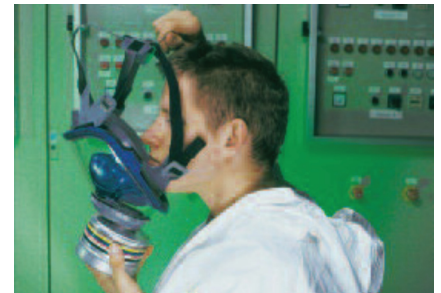
Legen Sie Ihr Kinn in die Kinn Tasche